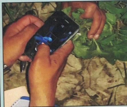
रोग तथा किरा पहिचान गर्दै