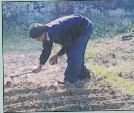
नर्सरीमा सकर रोपण गर्दै